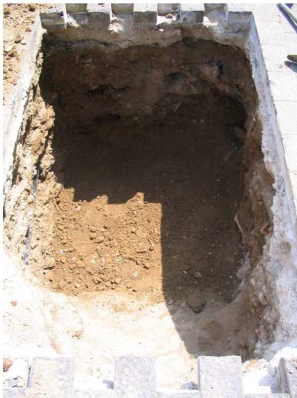
Fotografia núm. 3: Rasa 100 un cop oberta