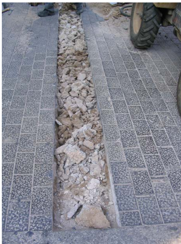
Fotografia núm. 2: Obertura de la rasa 100