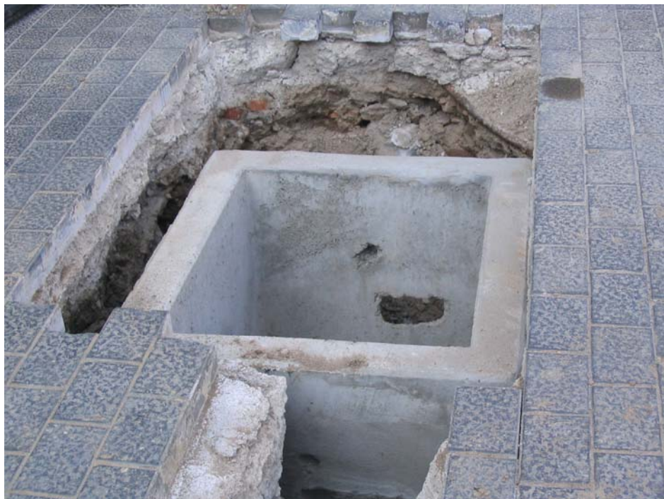
Fotografia núm. 6: Arqueta de connexions ja instal.lada