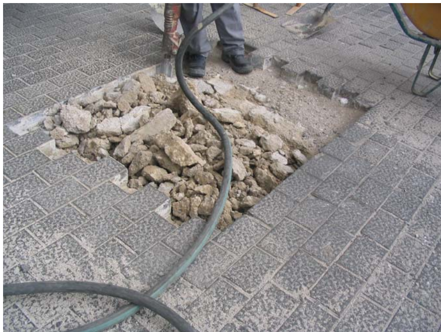
Fotografia núm. 1: Obertura de la rasa 100