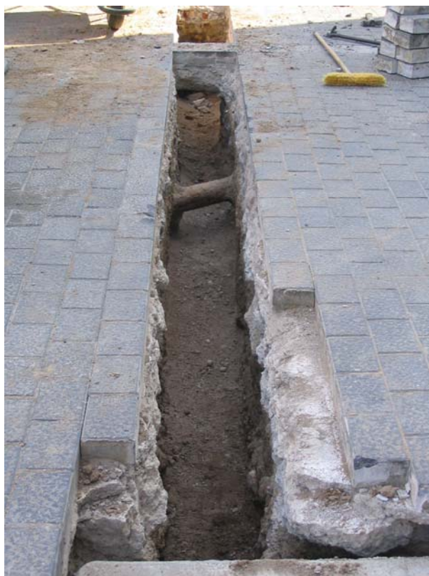
Fotografia núm. 4: Rasa 100 un cop oberta