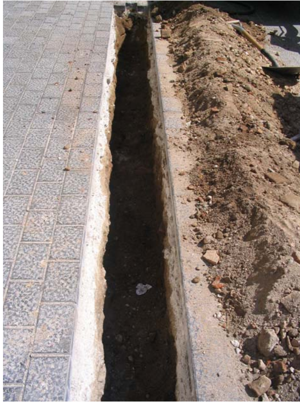
Fotografia núm. 5: rasa 100 un cop oberta